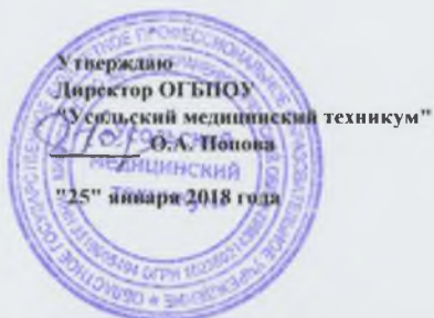
ГРАФИК УЧЕБНОГО ПРОЦЕССА НА ВТОРОЕ ПОЛУГОДИЕ 2017-2018 УЧЕБНОГО ГОДА