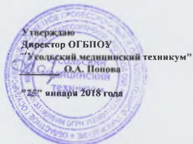
ГРАФИК УЧЕБНОГО ПРОЦЕССА НА ВТОРОЕ ПОЛУГОДИЕ 2017-2018 УЧЕБНОГО ГОДА