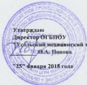
ГРАФИК УЧЕБНОГО ПРОЦЕССА НА ВТОРОЕ ПОЛУГОДИЕ 2017-2018 УЧЕБНОГО ГОДА