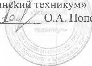
ГРАФИК ПРЕДВАРИТЕЛЬНОЙ ЗАЩИТЫ выпускных квалификационных работ по специальностям Кабинет № 3 корпус № 2